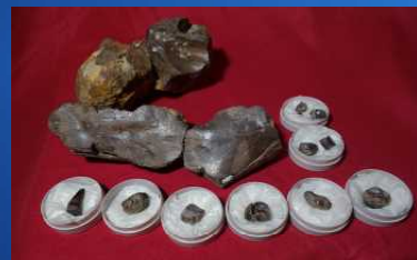
パレオパラドキシア寺尾標本