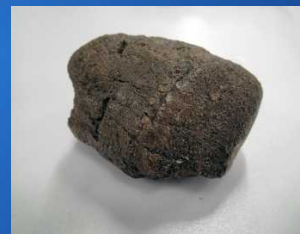
パレオパラドキシア皆野標本