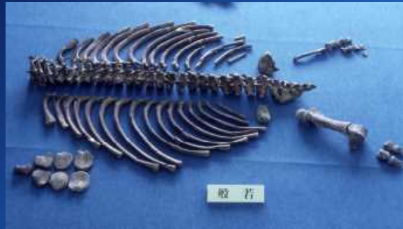
パレオパラドキシア般若標本