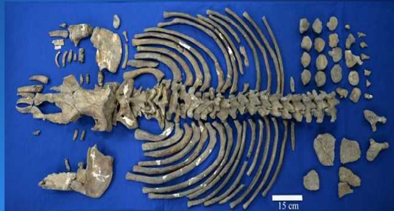
パレオパラドキシア大野原標本