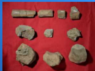
パレオパラドキシア栃谷標本