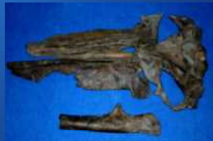
オガノヒゲクジラ般若標本