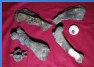
パレオパラドキシア三山標本