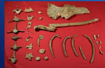
チチブクジラ蓼沼標本