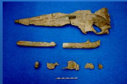
チチブクジラ大野原標本