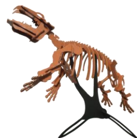
パレオパラドキシア 3Dペーパーパズル 税込600円