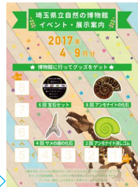
来館プレゼント案内リーフレット