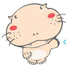
パレオパラドキシアをモチーフにしたキャラクター「大野原 治」

博物館を少しでも親しみやすく感じていただければと、オリジナルキャラクターを製作しています。製作は、学芸員が、考案からデータ作成まで行っています。展示パネルに登場させたり、各種広報物やホームページ等で活用しています。また、キャラクターをもとにしたグッズとして、キーホルダーの販売を開始しました。税込200円で販売しており、小さなお子様にも興味をもっています。