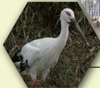
ニホンコウノトリ