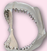
カルカロドン メガロドン 顎骨復元模型