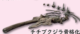
チチブクジラ骨格化石