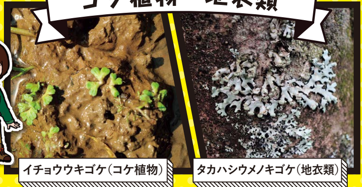
イチョウウキゴケ(コケ植物)