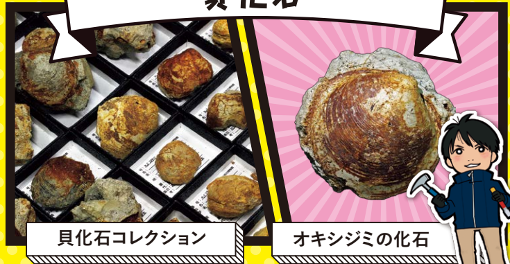
貝化石コレクション