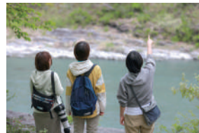
▲長瀬の風景を作り出す のはどんな植物？