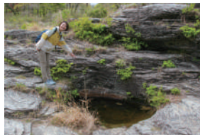
▲川の流れによってできた ポットホール

自然を知れば長瀬はもっと楽しい。本展をご覧になったあと、実 際にどのように楽しめばよいかを提案します。モデルコースや自 然史的な視点での見どころ、100年前から続く「映え」スポット なども紹介します。ここで予習すれば、岩畳を歩くのがますます 楽しくなるはず！