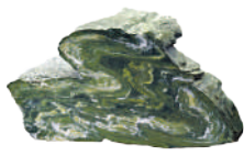
▲ れん 緑簾石片岩