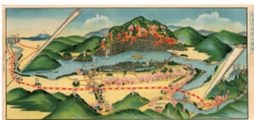
▲秩父ながとろ遊園地図繪

国指定名勝・天然記念物「長瀬」はいつから、どのように県内有 数の景勝地として知られるようになったのでしょうか。長瀬の地 質の概要や指定前後の歴史を紹介し、文化財としての価値を 考えます。