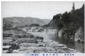
▲大正初期(推定)発行の 絵葉書

国の名勝・天然記念物に指定されて100年の間に、長瀬の環境 や風景は大きく変化してきました。大正～昭和初期の絵葉書な どをもとに、指定当時の環境の変化を考えます。また、外来 種の増加など、現在抱える新たな課題や、当館が進めている調 査についても紹介します。