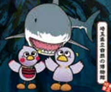
埼玉県マスコット コバトン&さいたまっち