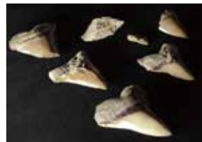
秩父市産出メガロドン歯群化石

古秩父湾に生息していた様々な化石動物を紹介! チチブクジラの復元模型を初公開するほか、巨大ザメ・メガロドンへの背骨やウロコの化石などを展示します。