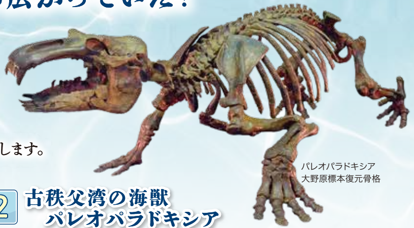
パレオパラドキシア 大野原標本復元骨格

その記憶は秩父盆地より産出する多くの化石から読み取ることができます。パレオパラドキシアをはじめとした、多くの海獣たちの化石を通して、秩父盆地に眠る太古の海の200万年間の物語を紹介します。