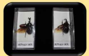
昆虫の裏表標本セット