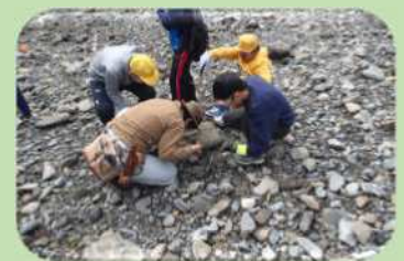
地層と化石の観察

※お申込みは1か月前(10~12月の実施については2か月前)までに行ってください。 なお、学芸員のスケジュール等によりご要望にお応えできない場合もあります。