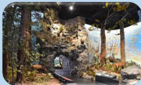
埼玉の森を再現した大ジオラマ