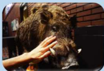
さわられるはく製コーナー