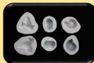
化石のレプリカ作成用の型のセット

※貸出方法については、原則、当館での直接の借用、返却となります。 ただし、送料をご負担いただければ、宅配便での輸送も可能です。