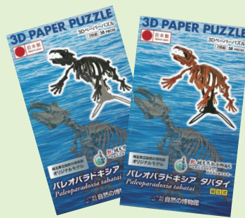
販売中の3Dペーパーパズル (黒・茶)