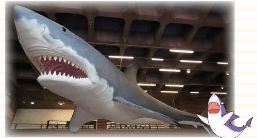
▲ カルカロン メガロドン復元模型